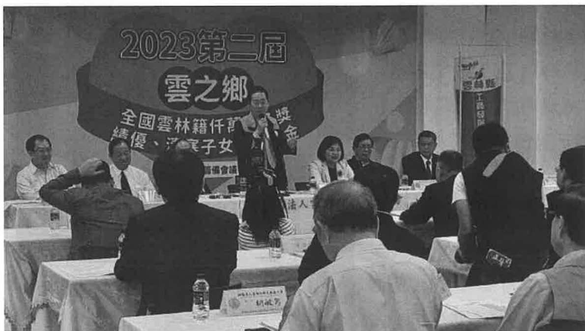
全國雲林籍千萬冠名獎助學基金於今年 2 月 19 日啟動募款，短時間就募得新台幣 912 萬元，嘉惠 304 名雲林子弟。

好施的雲林鄉親的聚力下『善行公益』，先後舉辦五屆全國「雲林金篆獎」書法比賽宏揚書藝文化，並彙編「第五屆雲林金篆獎書法比賽集」致贈母縣及各縣市政府學校、圖書館推廣書法國粹，也辦理六屆「勤樸獎」百萬清寒優秀子女獎助學金及 2014 第一屆「雲之鄉」冠名獎學金，還有育幼院愛心護幼濟助，連同本次捐助獎助學金累積挹注近伍仟萬元經費，回饋家鄉、嘉惠學子；此外，更辦理行銷二十鄉鎮市農漁特產展銷嘉年華會來幫助農漁民提高收益，就是希望能以實際行動幫助鄉親及學子。